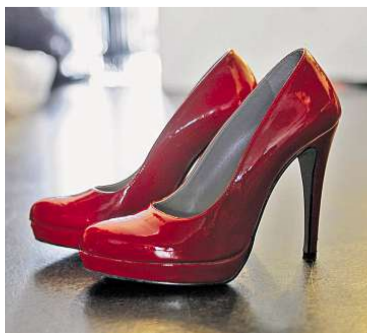
Nach einem Laufkurs hat Frau keine Angst mehr vor solchen Schuhen.