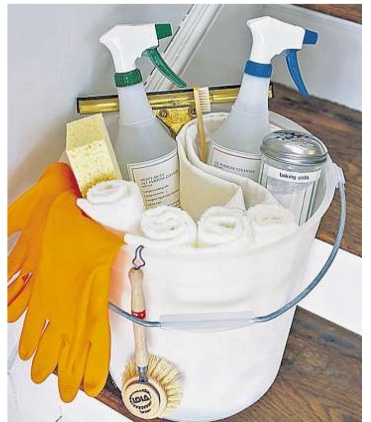
Wer hat nicht Lust, sein Putzzeug mal jemand anderem zu überlassen.