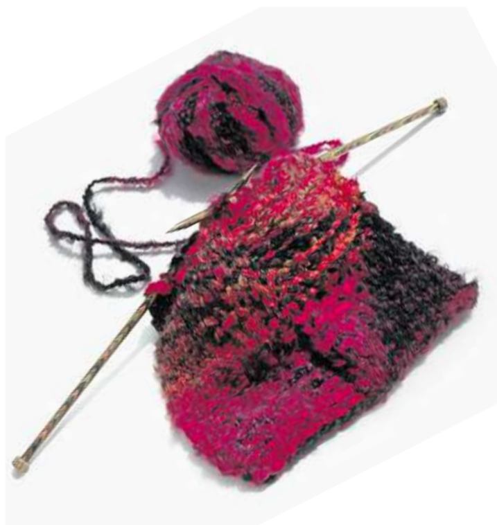
Wer nicht stricken kann, kann sich bei Tuttolana was stricken lassen.

Aber auch im Gemeinschaftszentrum Roos in Regensdorf sind Gutscheine für verschiedene Kurse in Werken und Gestalten erhältlich. Weitere Informationen finden sich auf der Webseite www.gzross.ch .